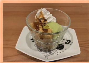
ミニパフェ (わらびもち) 450円