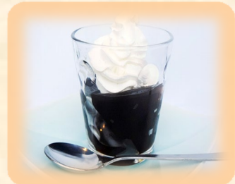
コーヒーゼリー 350円