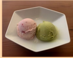
アイスクリーム 400円 ★アイス2つ