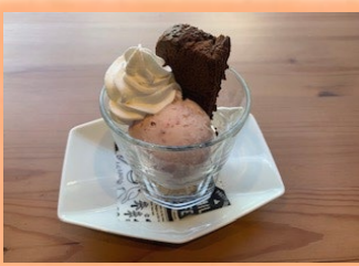
ミニパフェ (ガトーショコラ) 450円