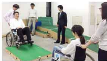
【研修実施主体】公益財団法人日本ケアフィット共育機構

時間 14:00~16:00(予定) 会場 新館2階 中研修室 対象 当館での公演ボランティア活動や講座内容に興味のある方(中学生以上) ※未成年の場合は要保護者承諾 定員 20名程度 ※応募多数の場合は抽選 申込期間 7月16日(水)~8月20日(水) ※本講座は公益財団法人日本ケアフィット共育機構による「サービス介助基礎研修」の受講料のうち、一部を当館が負担し、実施するものです。 料金 550円(教材費として)