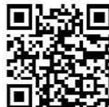
▲専用申込フォーム

※応募多数の場合は抽選となります。※申込結果は10月中旬頃に返信はがきもしくはメールにてお知らせいたします。