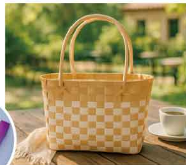
写真は白×ベージュ サイズ:約230×100×180mm