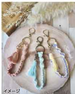
イメージ 好きなカラーが 選べます

糸は日本製のオーガニックコットンを使用。農業・科学薬品を使用していないので人と環境にやさしく、ナチュラルな風合いが気持ちよい素材です。当日、好きな色をお選びください。