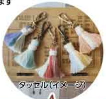
タッセル(イメージ)