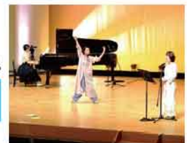
令和3年度採択事業 「ありがとう～愛が溢れるコンサート」