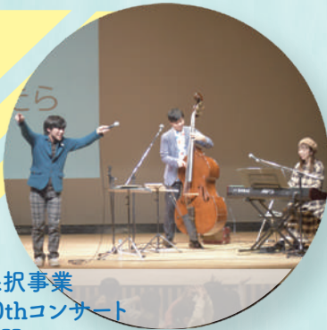
令和元年度採択事業 「えとおとスケッチ10thコンサート ～絵本と音の読み聞かせ～」