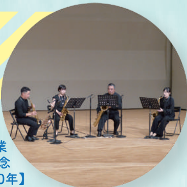
令和4年度採択事業 春日市制50周年記念 【音楽と共に振り返る50年】