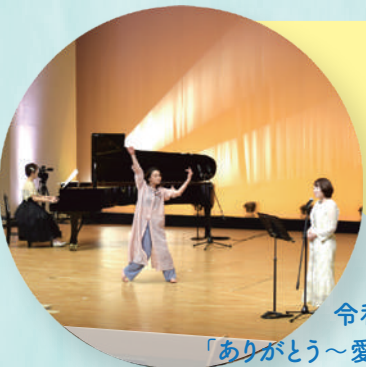
令和3年度採択事業 「ありがとう～愛が溢れるアートコンサート～」