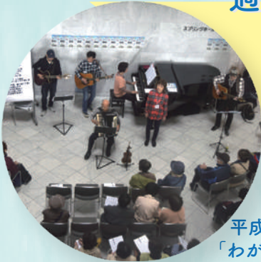
平成30年度採択事業 「わがまち選べる音楽会」