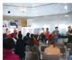
平成30年度採択事業 「わがまち選べる音楽会」

募集内容 以下のいずれかをお選びください。※いずれも音楽ジャンルは問わず。音楽とその他ジャンルとの組み合わせも可。