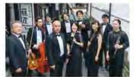
TAKETA室内オーケストラ九州