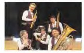
【企画制作】西日本音楽企画