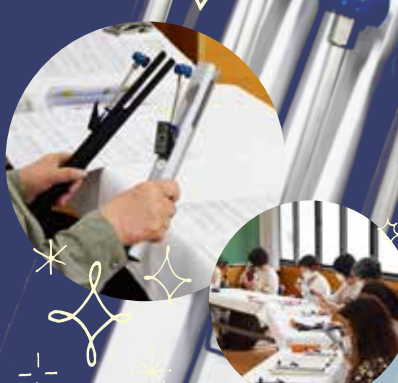
ふれふんトーンチャイム合奏団 練習風景

柔らかく心に沁み入るような音色のトーンチャイムは、誰でも簡単に演奏できる楽器です。楽しく演奏しながら脳の活性化による認知症予防の効果も期待できます。そんなトーンチャイムの魅力を体験していただける無料のワークショップを開催します！初めて楽器を演奏する方も「ふれふんトーンチャイム合奏団」のメンバーがサポートしますので、どうぞお気軽にご参加ください。みんなで一つの音楽を作り上げる楽しさを体感してみませんか？