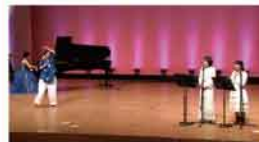
令和3年度採択事業「ありがとう ～愛が溢れるアートコンサート～」