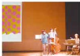
令和元年度採択事業 「えとおとスケッチ10thコンサート ～絵本と音の読み聞かせ～」