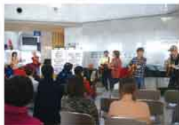
平成30年度採択事業 「わがまち選べる音楽会」