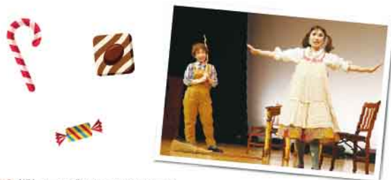
【協力】(株)ステージクルーネットワーク