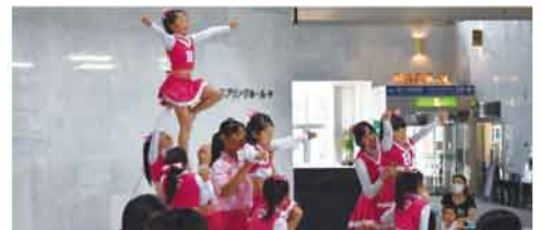
これまでのステージの様子