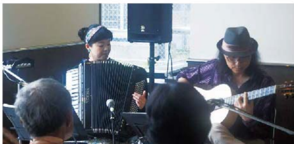
過去の「Café de ブランチコンサート」の様子

再開が決定いたしましたら、エイ・メッセおよびホームページにてお知らせいたします。