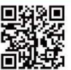
専用申込フォーム QRコード

※受付完了後、1週間以内に担当者より折り返しのご連絡を差し上げます。また、申込締切後、3日以内に参加の可否をメール (メールアドレスをお持ちで ない場合は電話) にてお知らせいたします。いずれの場合もこちらからのご連絡がない場合は、お手数ですが、お問い合わせください。